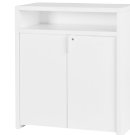
Maße: 95 x 110

Hinweis: Mietobjekt und nur in Verbindung mit Standbegrenzungswänden buchbar.