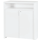
Maße: 95 x 110