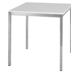
Maße: klein (70 x 72) groß (110 x 72)