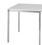
Maße: klein (70x72) groß (110x72)